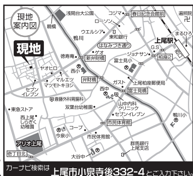
カーナビ検索は 上尾市小泉寺後332-4 とこ入力下さい。