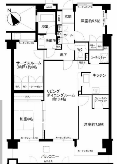
【コスモ上尾ロイヤルフォールム 3階部分】