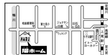
上尾西口駅前通り

(社)埼玉県宅地建物取引業協会会員・(社)全国宅地建物取引業保証協会会員 埼玉県知事免許(3)第018377号・建設業許可番号 埼玉県知事(般-22)第55595号