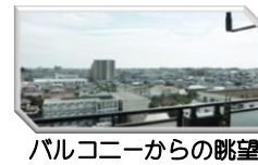
バルコニーからの眺望